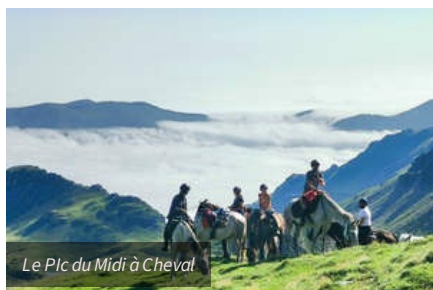
Le Pic du Midi à Cheval