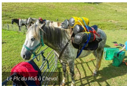
Le Pic du Midi à Cheval