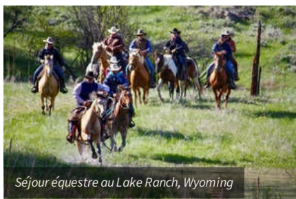
Séjour équestre au Lake Ranch, Wyoming