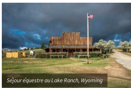
Séjour équestre au Lake Ranch, Wyoming