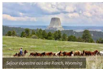
Séjour équestre au Lake Ranch, Wyoming