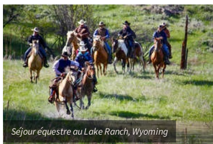
Séjour équestre au Lake Ranch, Wyoming