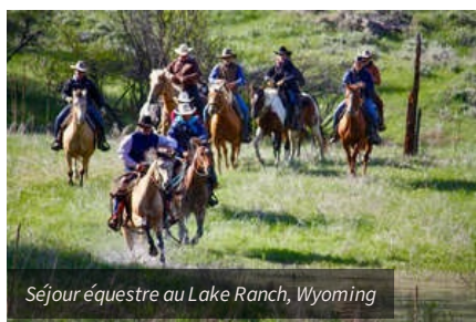
Séjour équestre au Lake Ranch, Wyoming