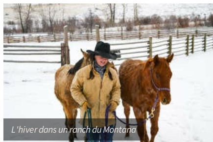
L'hiver dans un ranch du Montana