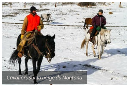
Cavaliers sur la neige du Montana