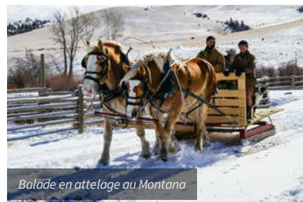
Balade en attelage au Montana