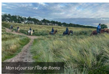
Mon séjour sur l'île de Romo