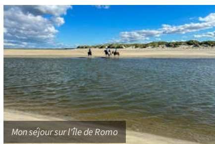
Mon séjour sur l'île de Romo