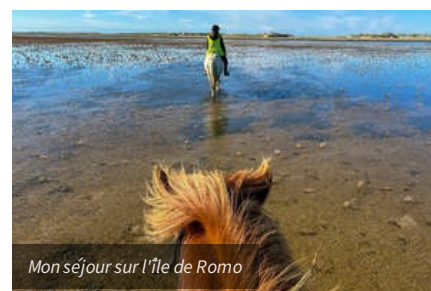
Mon séjour sur l'île de Romo