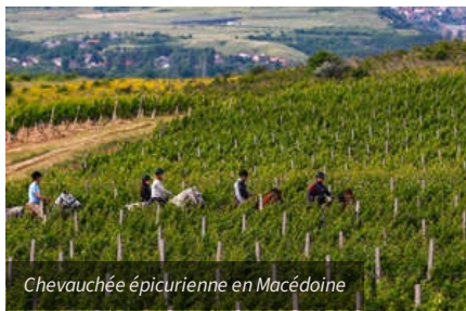
Chevauchée épicurienne en Macédoine