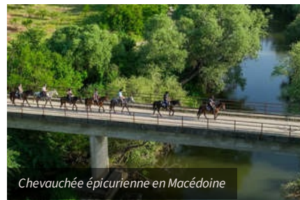
Chevauchée épicurienne en Macédoine