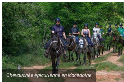
Chevauchée épicurienne en Macédoine