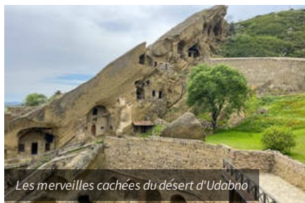
Les merveilles cachées du désert d'Udabno