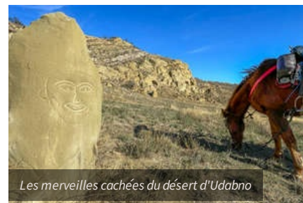
Les merveilles cachées du désert d'Udabno