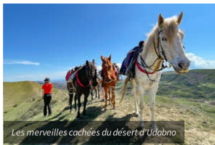
Les merveilles cachées du désert d'Udabno