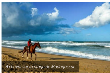
A cheval sur la plage de Madagascar