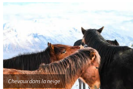
Chevaux dans la neige