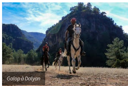
Galop à Dalyan