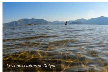
Les eaux claires de Dalyan