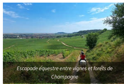
Escapade équestre entre vignes et forêts de Champagne