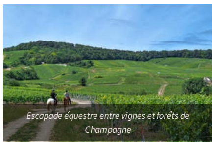
Escapade équestre entre vignes et forêts de Champagne