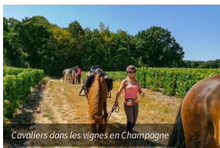
Cavaliers dans les vignes en Champagne