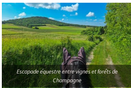
Escapade équestre entre vignes et forêts de Champagne