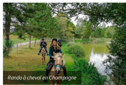
Rando à cheval en Champagne