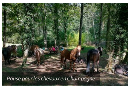
Pause pour les chevaux en Champagne