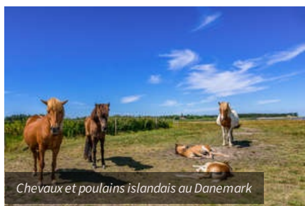
Chevaux et poulains islandais au Danemark