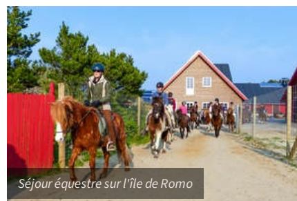
Séjour équestre sur l'île de Romo