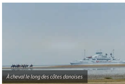
À cheval le long des côtes danoises