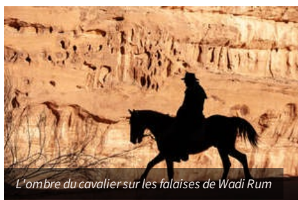
L'ombre du cavalier sur les falaises de Wadi Rum