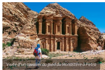
Visite d'un cavalier au pied du Monastère à Petra