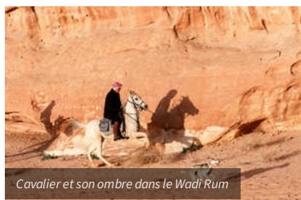
Cavalière et son ombre dans le Wadi Rum