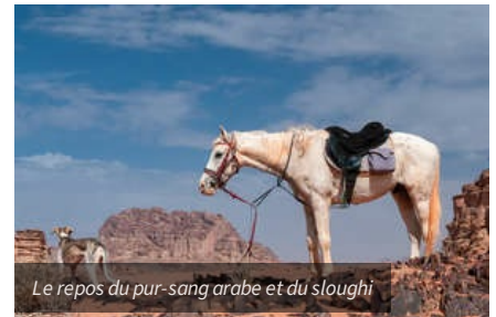
Le repos du pur-sang arabe et du sloughi