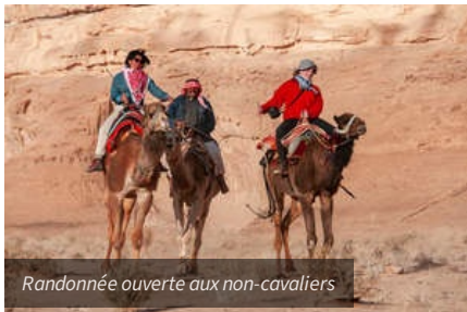
Randonnée ouverte aux non-cavaliers