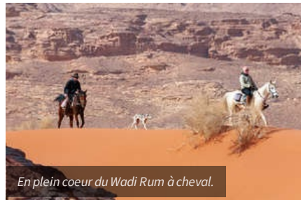
En plein cœur du Wadi Rum à cheval.