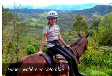
Jeune cavalière en Colombie