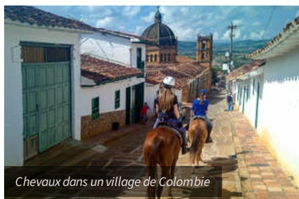
Chevaux dans un village de Colombie