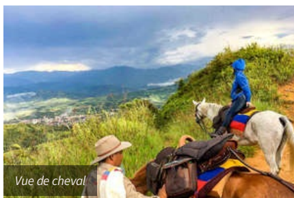
Vue de cheval