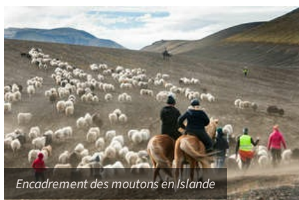
Encadrement des moutons en Islande