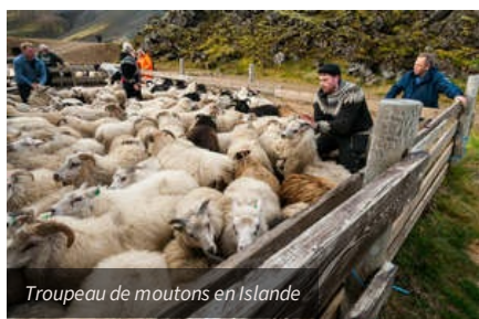
Troupeau de moutons en Islande