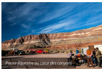
Pause équestre au cœur des canyons