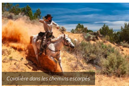
Cavalière dans les chemins escarpés