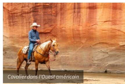
Cavalier dans l'Ouest américain