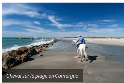
Cheval sur la plage en Camargue