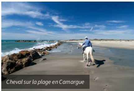
Cheval sur la plage en Camargue