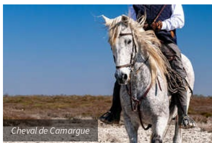
Cheval de Camargue