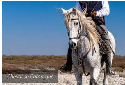
Cheval de Camargue