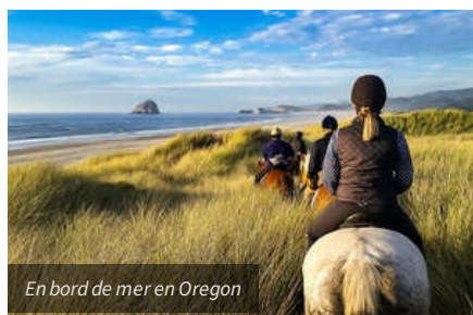
En bord de mer en Oregon