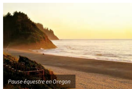
Pause équestre en Oregon