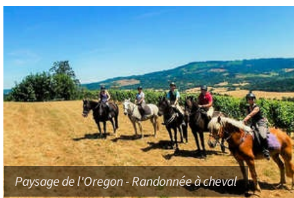
Paysage de l'Oregon - Randonnée à cheval