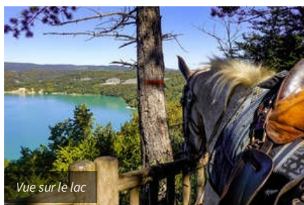
Vue sur le lac