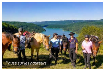
Pause sur les hauteurs