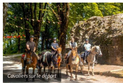
Cavaliers sur le départ