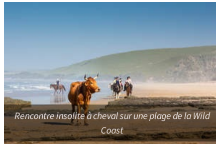
Rencontre insolite à cheval sur une plage de la Wild Coast