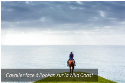
Cavalier face à l'océan sur la Wild Coast