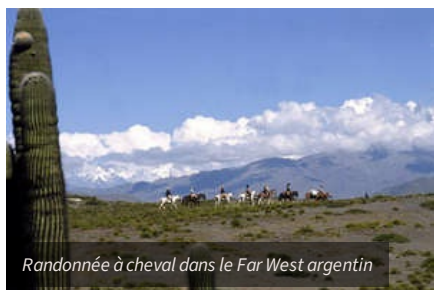
Randonnée à cheval dans le Far West argentin