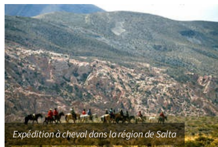
Expédition à cheval dans la région de Salta