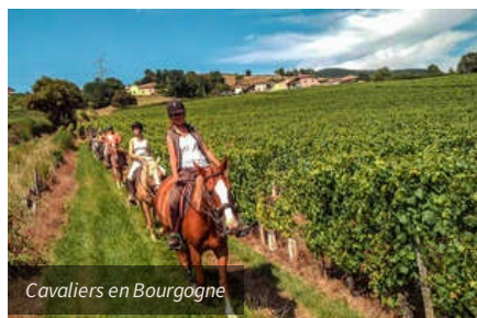
Cavaliers en Bourgogne