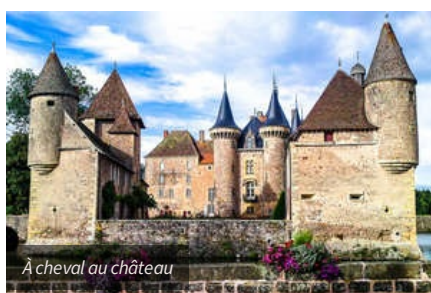
À cheval au château