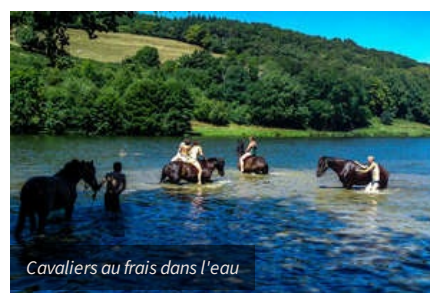
Cavaliers au frais dans l'eau