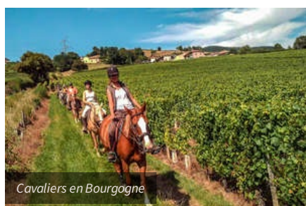
Cavaliers en Bourgogne