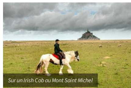
Sur un Irish Cob au Mont Saint Michel