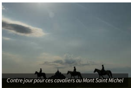
Contre jour pour ces cavaliers au Mont Saint Michel