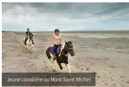
Jeune cavalière au Mont Saint Michel