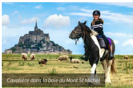
Cavalière dans la baie du Mont St Michel