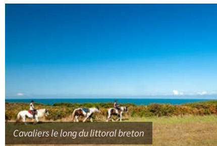
Cavaliers le long du littoral breton