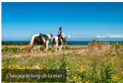
Chevaux le long de la mer