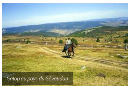
Galop au pays du Gévaudan