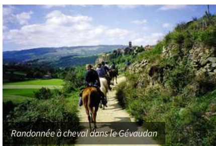
Randonnée à cheval dans le Gévaudan