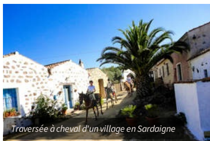
Traversée à cheval d'un village en Sardaigne