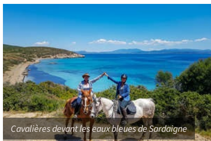
Cavalières devant les eaux bleues de Sardaigne