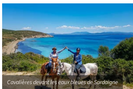
Cavalières devant les eaux bleues de Sardaigne