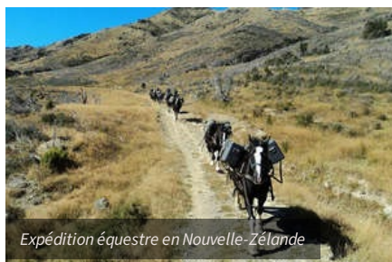
Expédition équestre en Nouvelle-Zélande