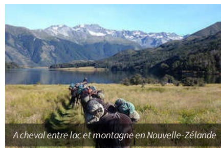
A cheval entre lac et montagne en Nouvelle-Zélande