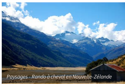
Paysages - Rando à cheval en Nouvelle-Zélande