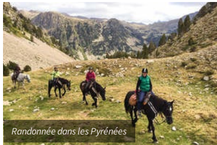
Randonnée dans les Pyrénées