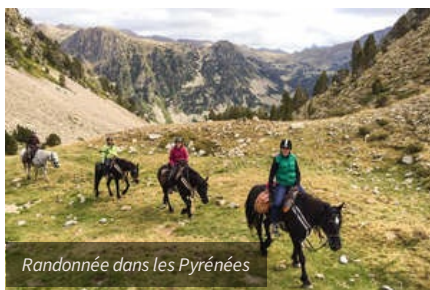
Randonnée dans les Pyrénées