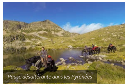
Pause désaltérante dans les Pyrénées