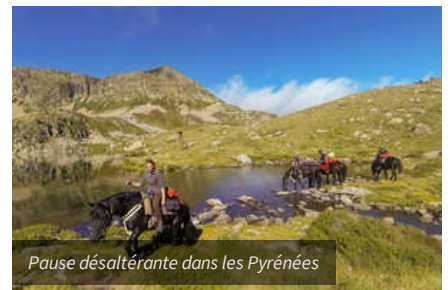
Pause désaltérante dans les Pyrénées