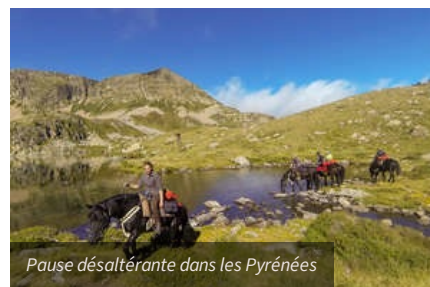
Pause désaltérante dans les Pyrénées