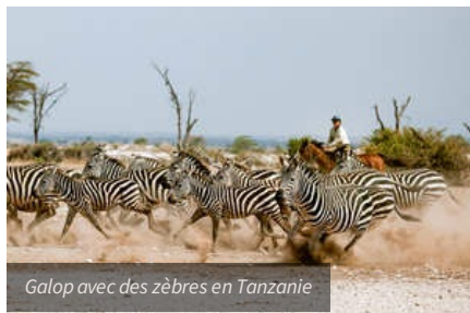
Galop avec des zèbres en Tanzanie