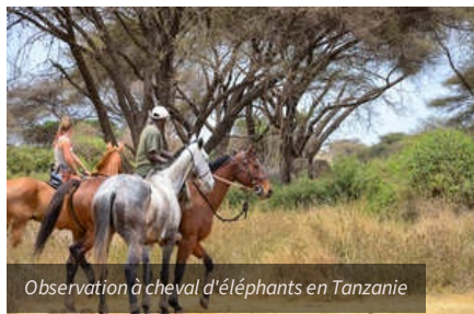
Observation à cheval d'éléphants en Tanzanie