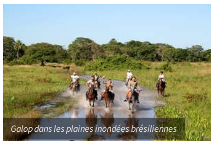
Galop dans les plaines inondées brésiliennes