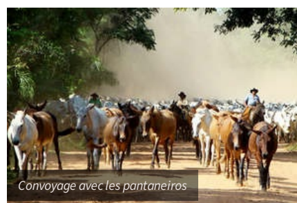
Convoyage avec les pantaneiros