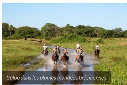
Galop dans les plaines inondées brésiliennes