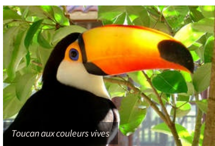
Toucan aux couleurs vives