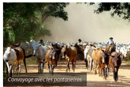
Convoyage avec les pantaneiros