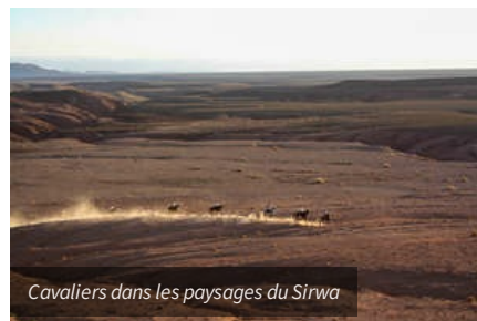
Cavaliers dans les paysages du Sirwa