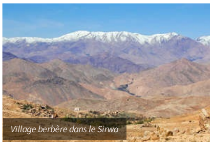
Village berbère dans le Sirwa