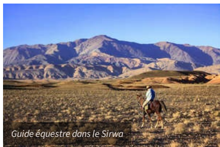
Guide équestre dans le Sirwa