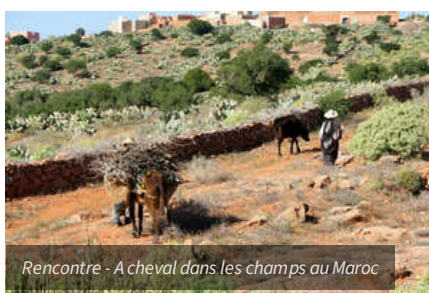
Rencontre - A cheval dans les champs au Maroc