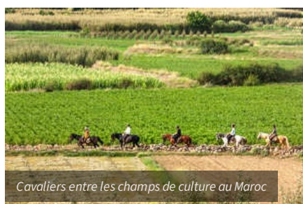
Cavaliers entre les champs de culture au Maroc