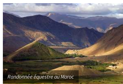
Randonnée équestre au Maroc