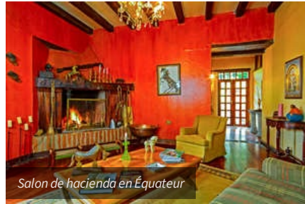
Salon de hacienda en Équateur