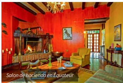
Salon de hacienda en Équateur