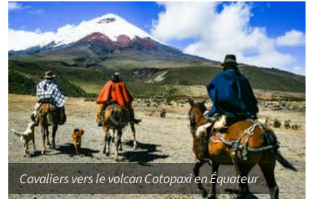
Cavaliers vers le volcan Cotopaxi en Équateur