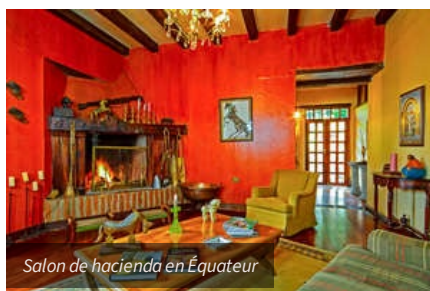
Salon de hacienda en Équateur