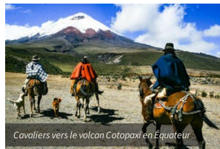
Cavaliers vers le volcan Cotopaxi en Équateur