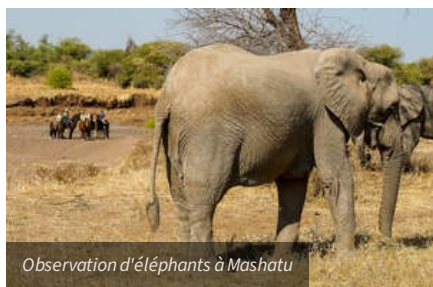
Observation d'éléphants à Mashatu