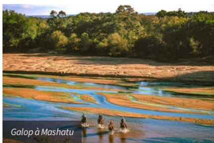
Galop à Mashatu