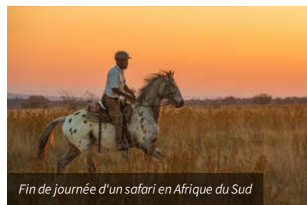
Fin de journée d'un safari en Afrique du Sud