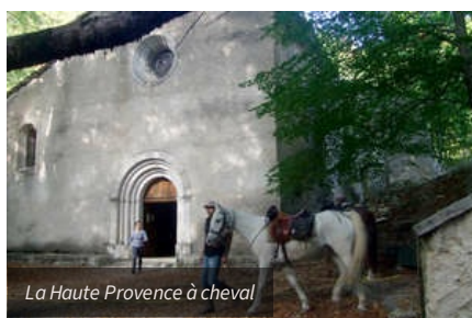
La Haute Provence à cheval