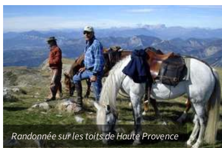
Randonnée sur les toits de Haute Provence