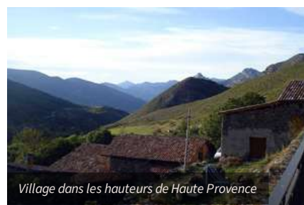
Village dans les hauteurs de Haute Provence