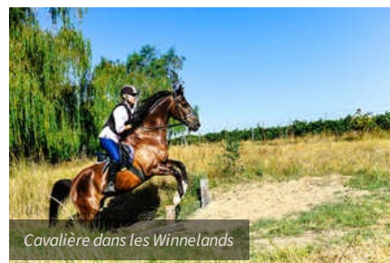
Cavalière dans les Winnelands