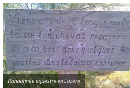
Randonnée équestre en Lozère