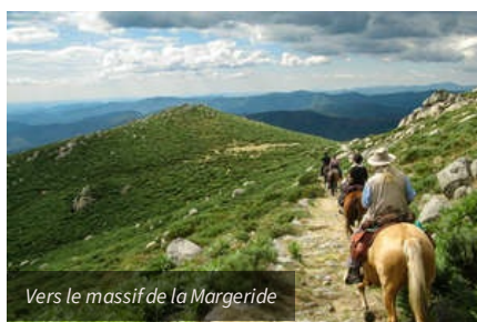
Vers le massif de la Margeride