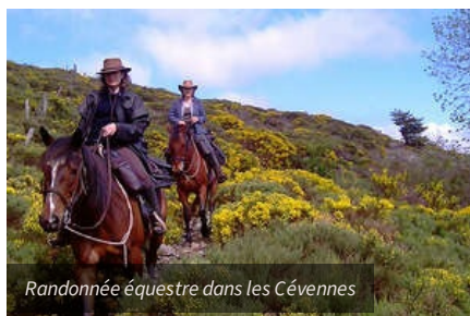
Randonnée équestre dans les Cévennes