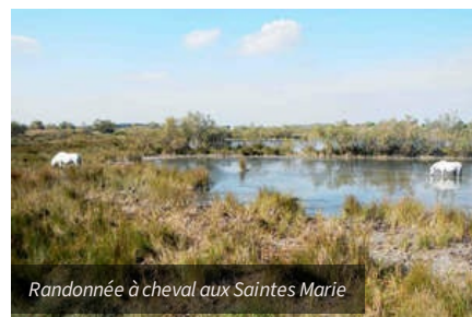
Randonnée à cheval aux Saintes Marie