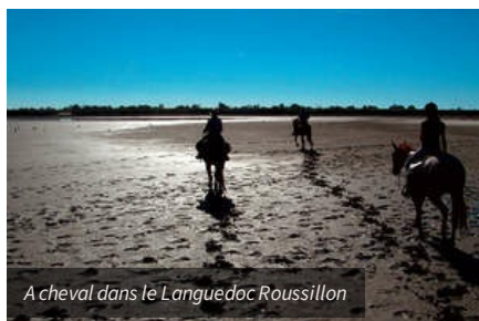
A cheval dans le Languedoc Roussillon