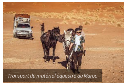
Transport du matériel équestre au Maroc