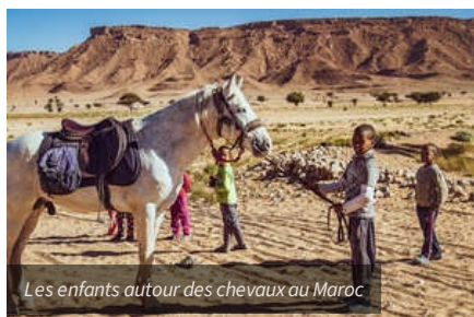
Les enfants autour des chevaux au Maroc