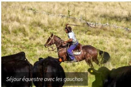
Séjour équestre avec les gauchos