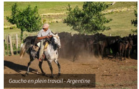
Gaicho en plein travail - Argentine