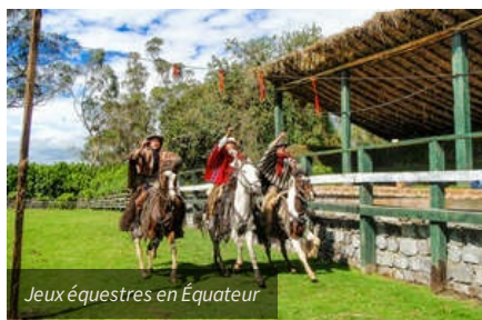
Jeux équestres en Equateur