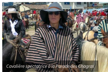
Cavalière spectatrice à la Parade des Chagras