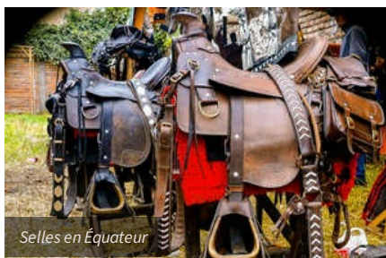
Selles en Equateur