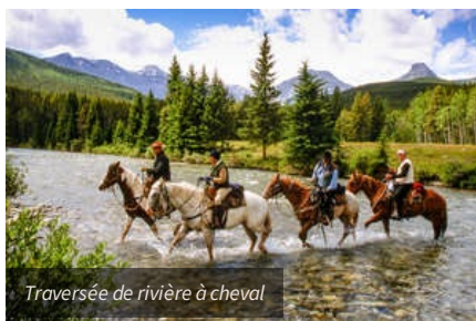
Traversée de rivière à cheval