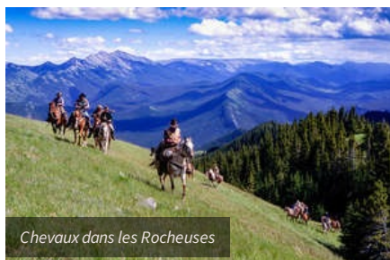
Chevaux dans les Rocheuses