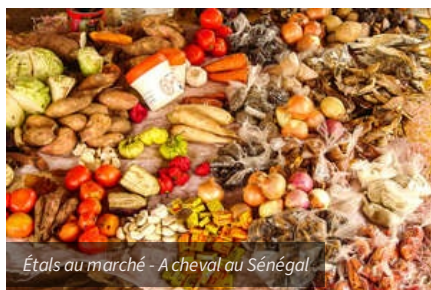
Étals au marché - A cheval au Sénégal