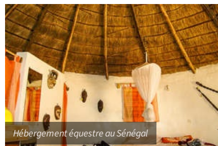
Hébergement équestre au Sénégal