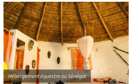
Hébergement équestre au Sénégal