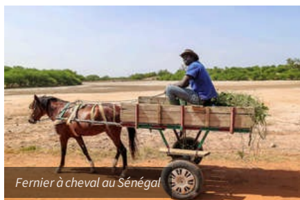
Farnier à cheval au Sénégal