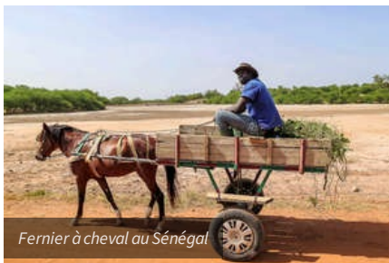
Farnier à cheval au Sénégal