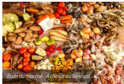
Étals au marché - A cheval au Sénégal