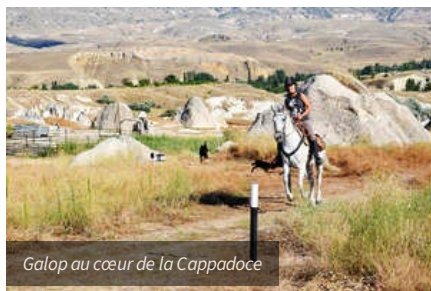
Galop au cœur de la Cappadoce