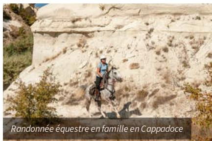
Randonnée équestre en famille en Cappadoce