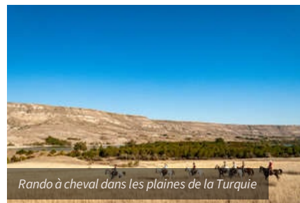
Rando à cheval dans les plaines de la Turquie