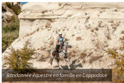
Randonnée équestre en famille en Cappadoce