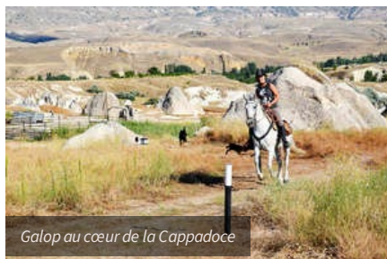
Galop au cœur de la Cappadoce