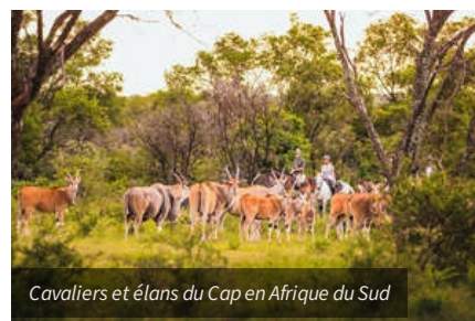
Cavaliers et élands du Cap en Afrique du Sud