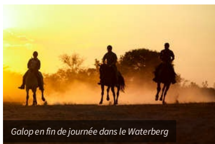
Galop en fin de journée dans le Waterberg