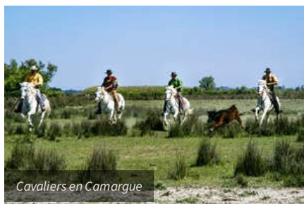
Cavaliers en Camargue