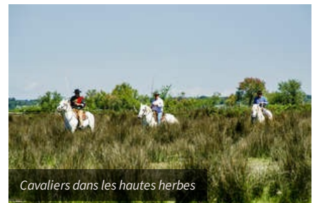
Cavaliers dans les hautes herbes