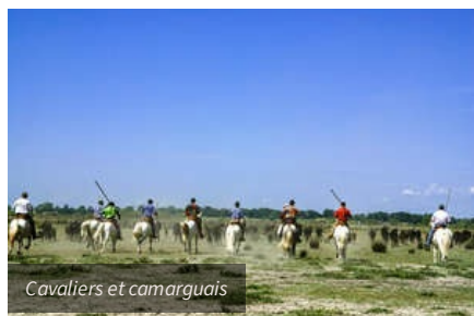
Cavaliers et camarguais