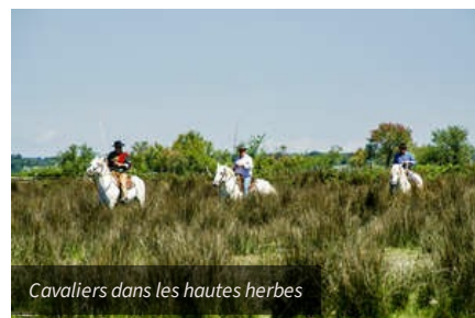
Cavaliers dans les hautes herbes