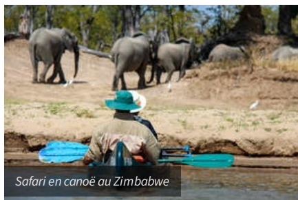
Safari en canoë au Zimbabwe