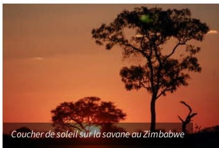
Coucher de soleil sur la savane au Zimbabwe