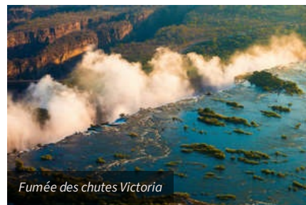
Fumée des chutes Victoria