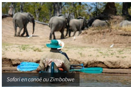
Safari en canoë au Zimbabwe