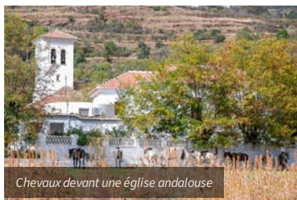
Chevaux devant une église andalouse