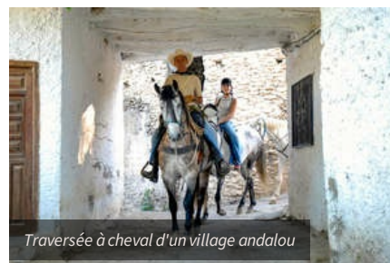
Traversée à cheval d'un village andalou