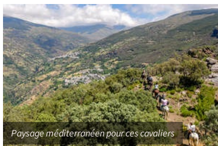
Paysage méditerranéen pour ces cavaliers