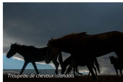
Troupeau de chevaux islandais