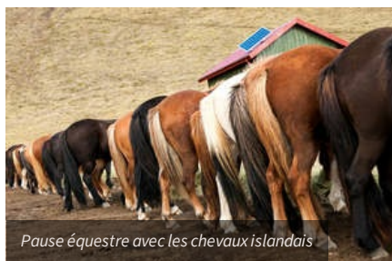
Pause équestre avec les chevaux islandais