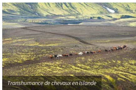
Transhumance de chevaux en Islande